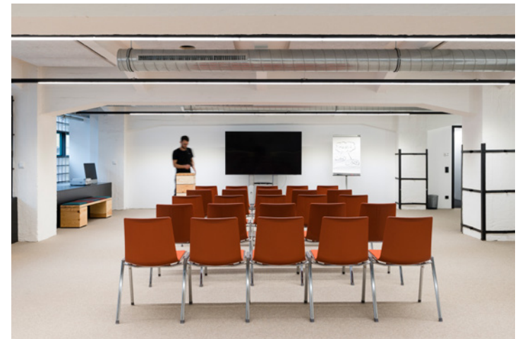
Workshopraum Libre: Kann kostenpflichtig dazugemietet werden.